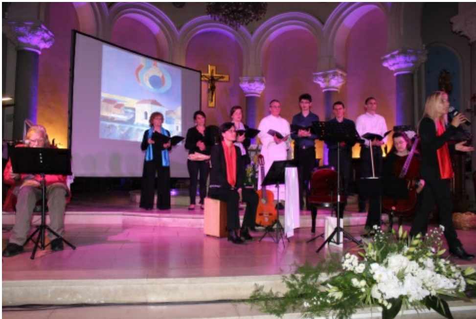
Concert « Passion Résurrection » créé par Marine de Charrin et Marie Dillenschneider, avec l'ensemble vocal du Petit Echo ©