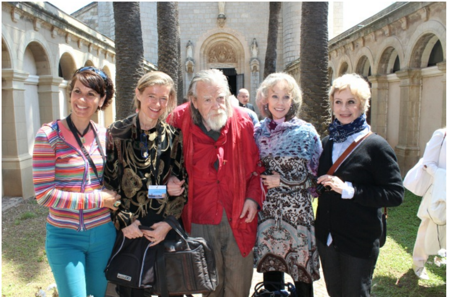
Michael Lonsdale avec une partie de l'équipe de la diaconie à Cannes