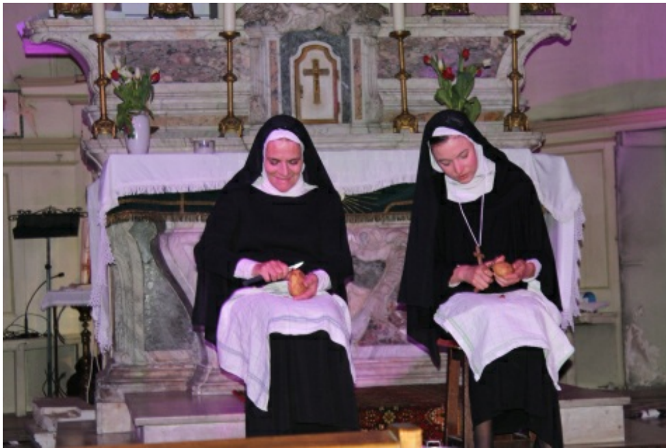
Spectacle de Faustine à la chapelle de la Miséricorde à Cannes le 18 mai