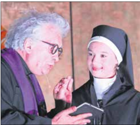
Zuster Faustina bad om barmhartigheid tegen het geweld.